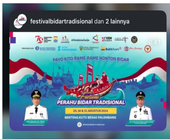
Gambar 3 Pemanfaatan Platform Digital Sebagai Media Promosi