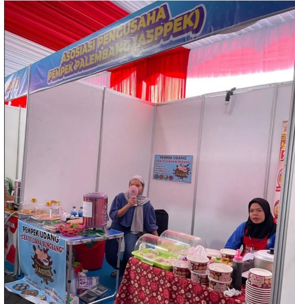
Gambar 4 UMKM saat pelaksanaan acara festival bidar tradisional