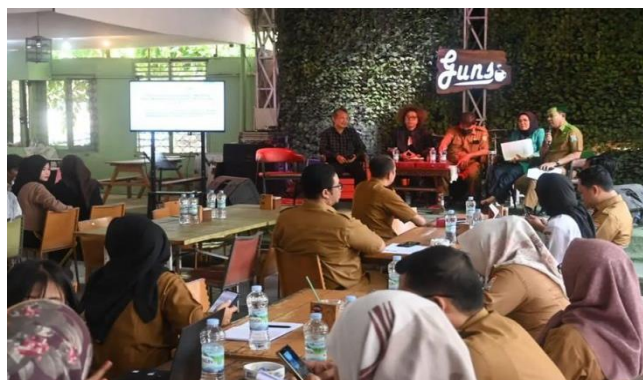
Gambar 2 Keterlibatan Aktif Staf Dalam Persiapan Pelaksanaan

Pariwisata memberikan pelatihan dan dukungan promosi agar masyarakat mendapatkan manfaat ekonomi langsung dari festival ini. Keseluruhan pelaksanaan menunjukkan adanya sinergi antara pegawai dinas dan masyarakat yang berkontribusi terhadap suksesnya acara serta pelestarian budaya dan pengembangan pariwisata di Kota Palembang.